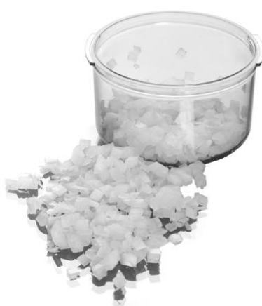
Slika 1: Zbirna posodica.

Zgornji del dvignete pravokotno na spodnjega in ga povlečete navzgor. Z obratnim postopkom nastavite drugi del.