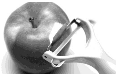
Slika 1: Lupljenje